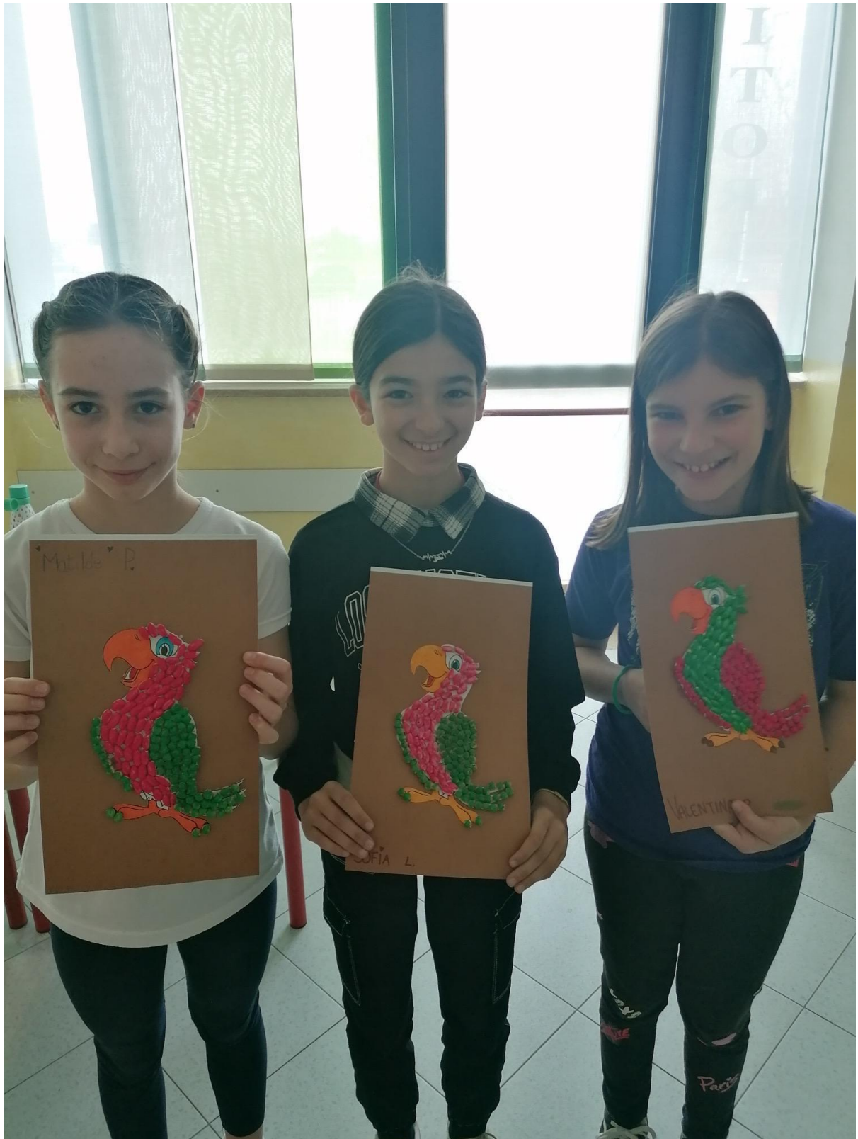
Esotico è bello (5^A)