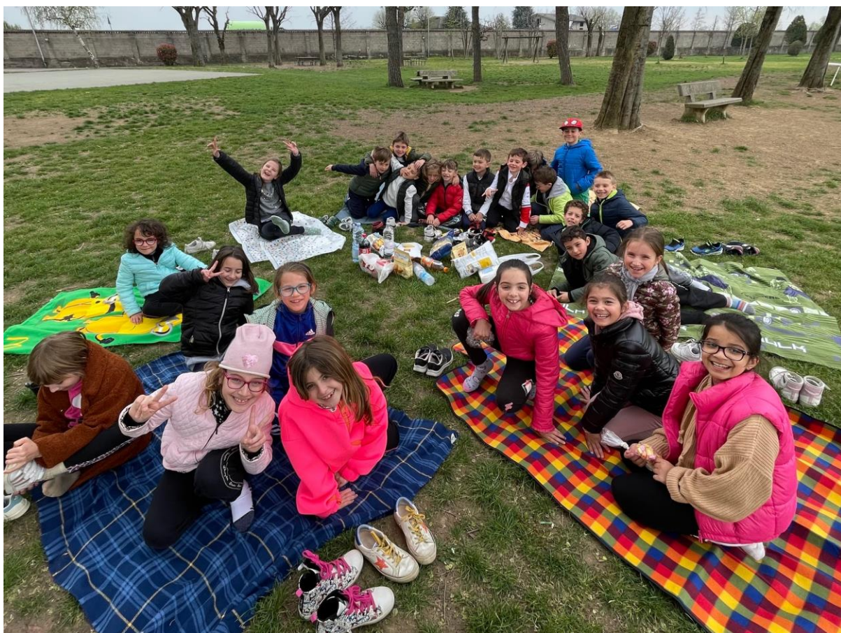
Picnic di classe, divertimento assicurato (2^C)