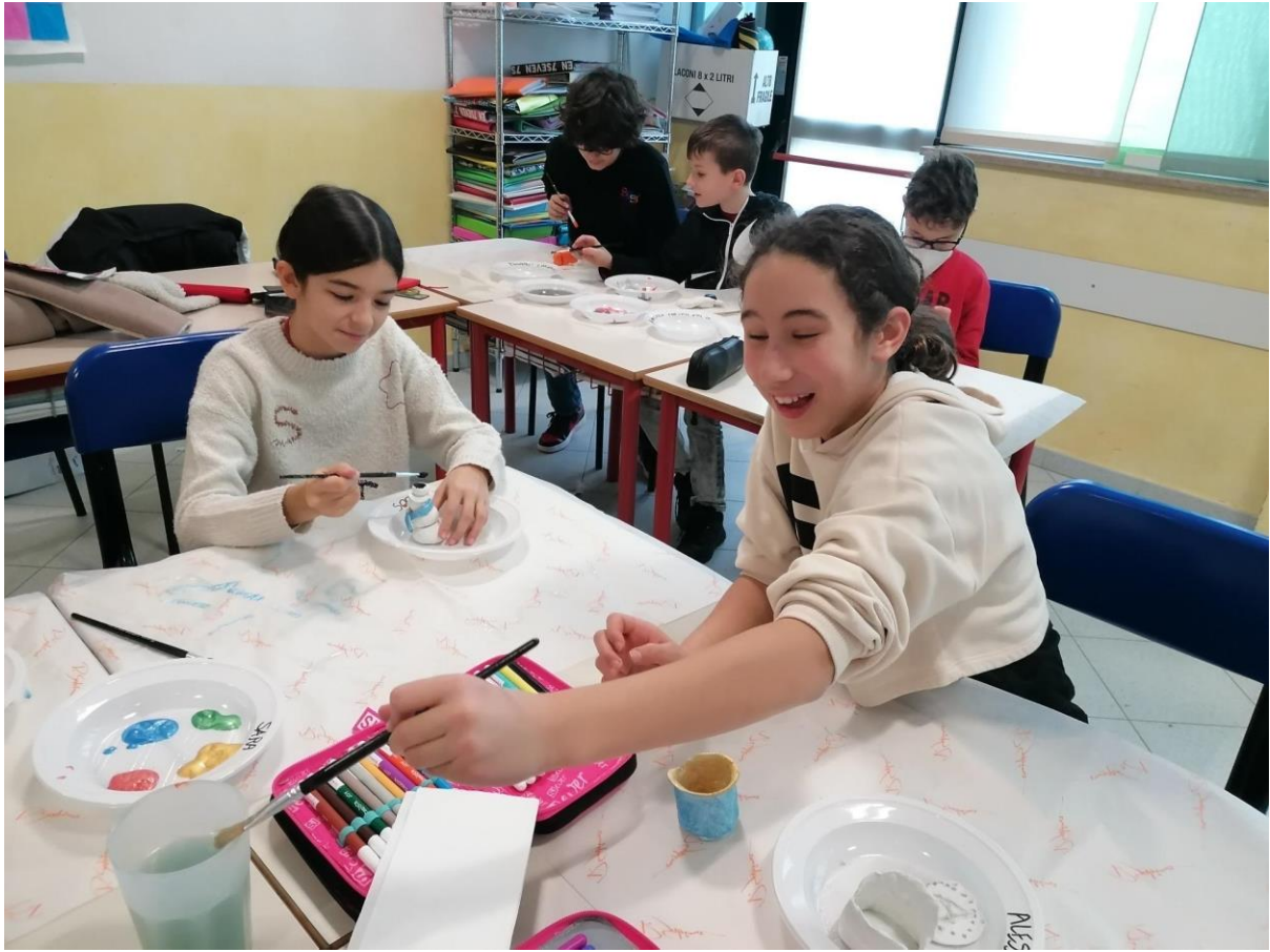
Vogliamo vivere una vita a colori! (Classi 5 ^ )