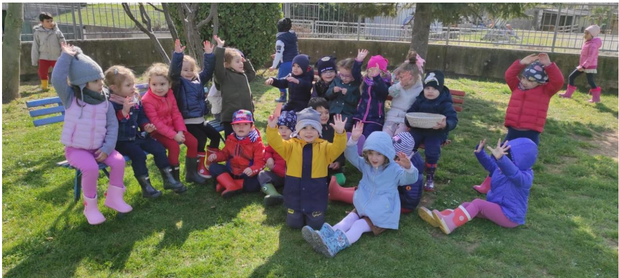
"La felicità è condividere ciò che viviamo a scuola con i nostri compagni." (Infanzia)