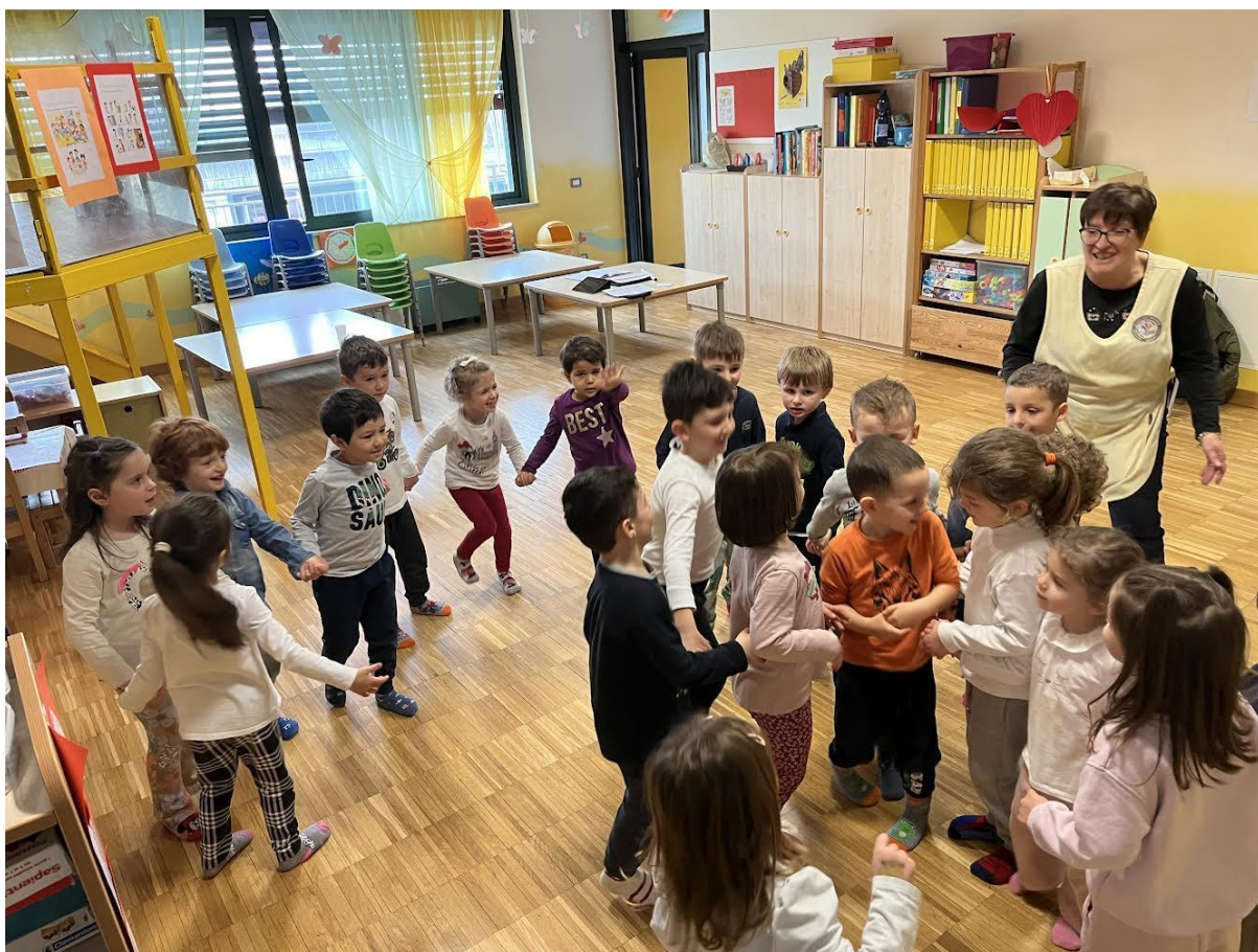
La gioia di imparare e giocare insieme (I Gialli dell'Infanzia).