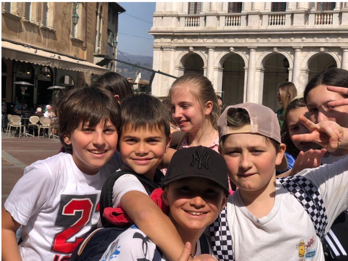
È bello scoprire le bellezze della nostra terra bergamasca insieme! (5^C)