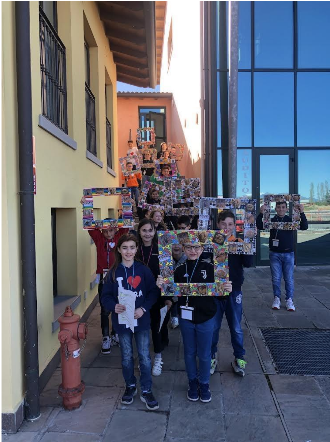
La felicità dell'attesa dei bimbi dell'infanzia prima del progetto FAI (classi 4 ^ ).