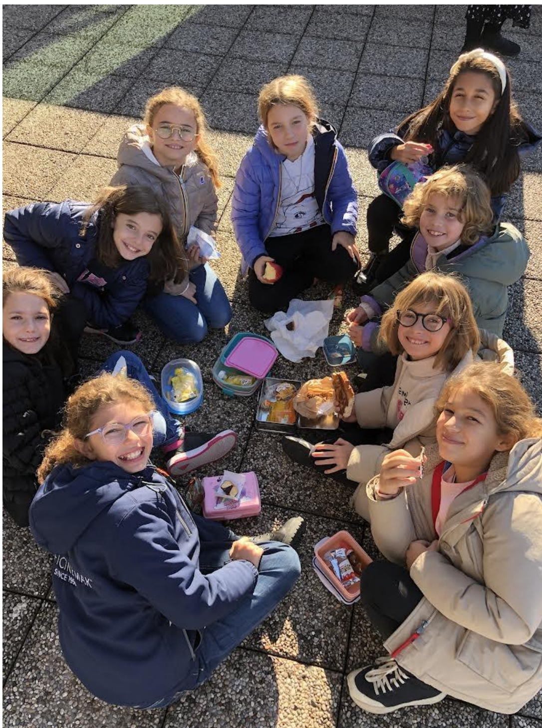
La gioia nel condividere la merenda (Giornata della Gentilezza). (4^D)