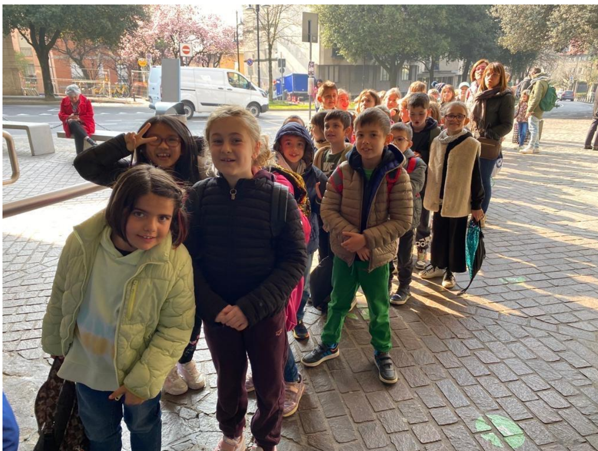
Aspettiamo la funicolare tutti in fila: non vediamo l'ora di vedere cose belle della nostra Bergamo! (2^D)