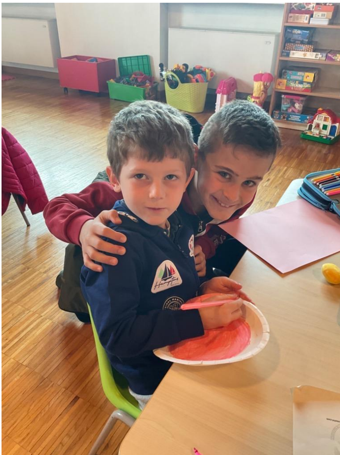
'Service learning' come momento di condivisione della gioia di crescere insieme (Infanzia e Primaria).