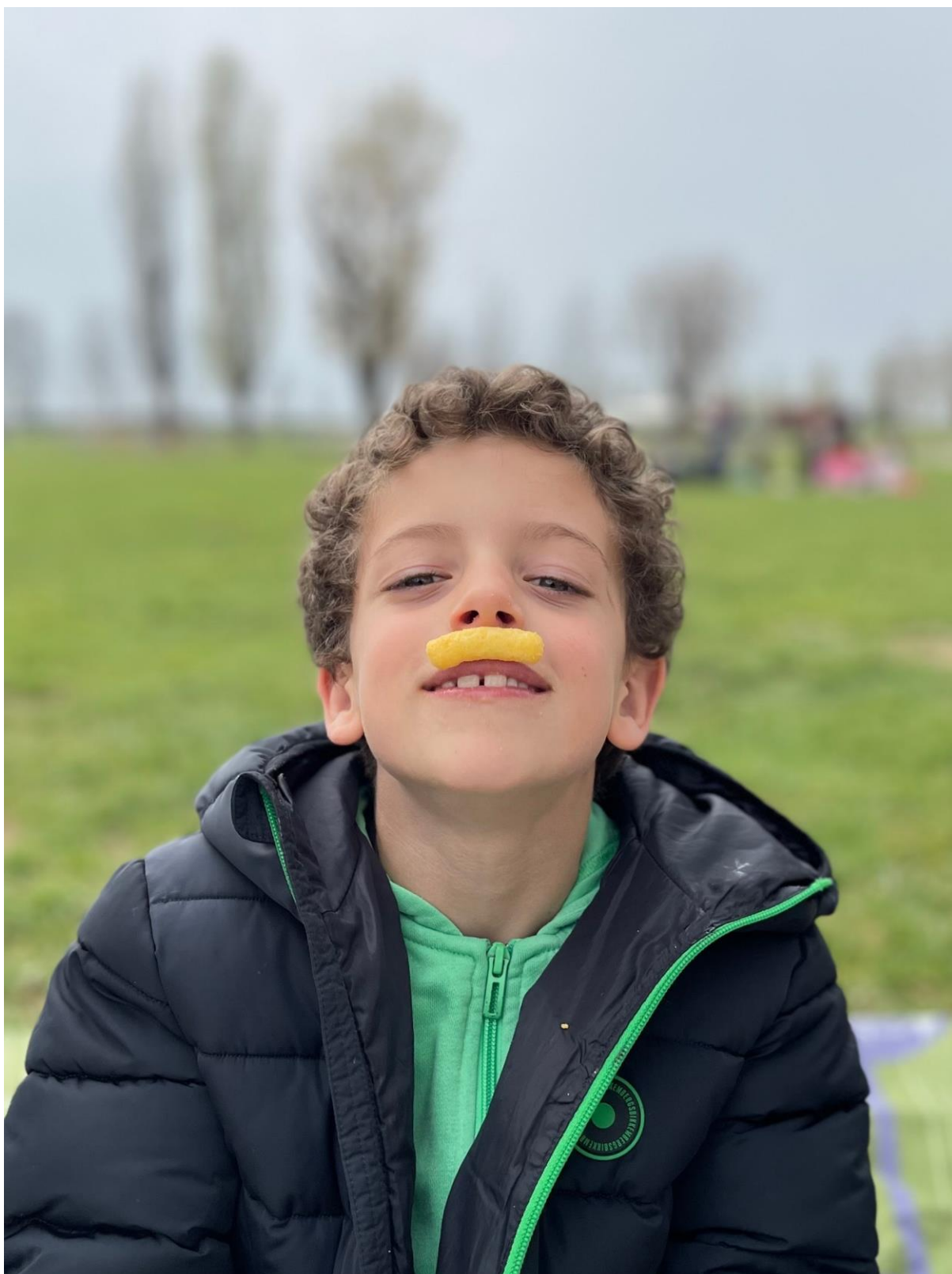
Baffo o patatina? (2^C)