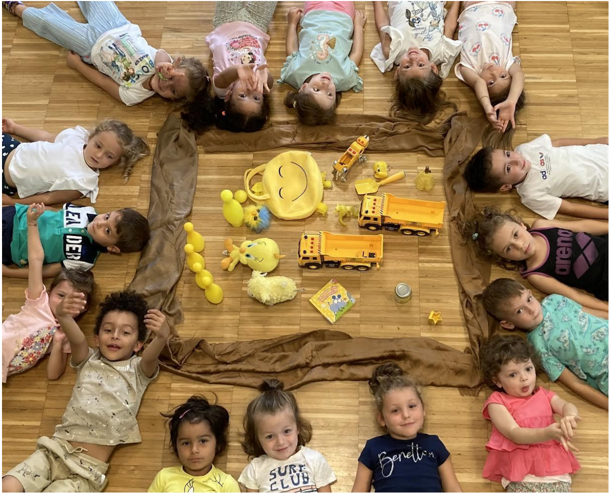
"The joy of staying together " Green class (Infanzia)