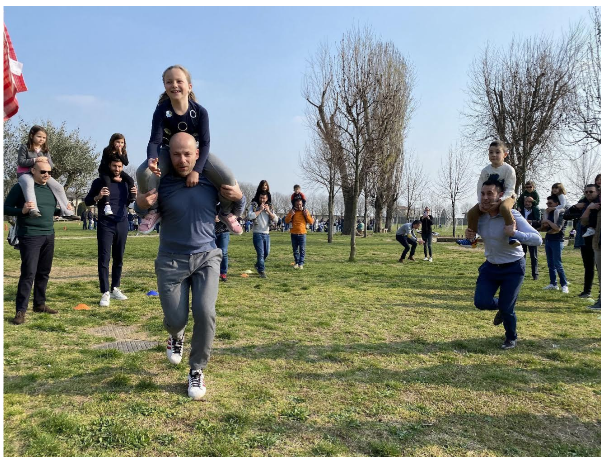
Una nostra Pasqua: la nostra rinascita dopo il buio della pandemia: i papà che entrano a scuola e si divertono felicemente con i loro figli e con gli insegnanti. (Primaria)