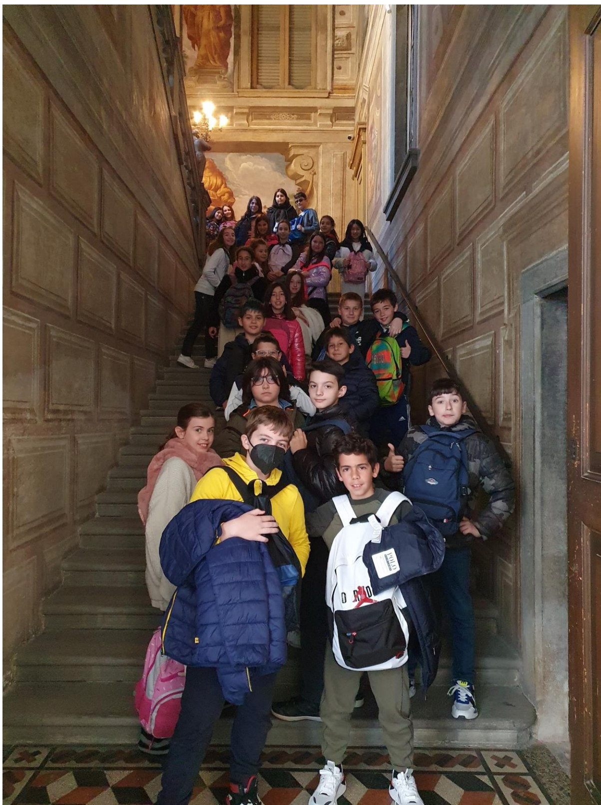
Andiamo a palazzo: principi e principesse per un giorno... (5^A)