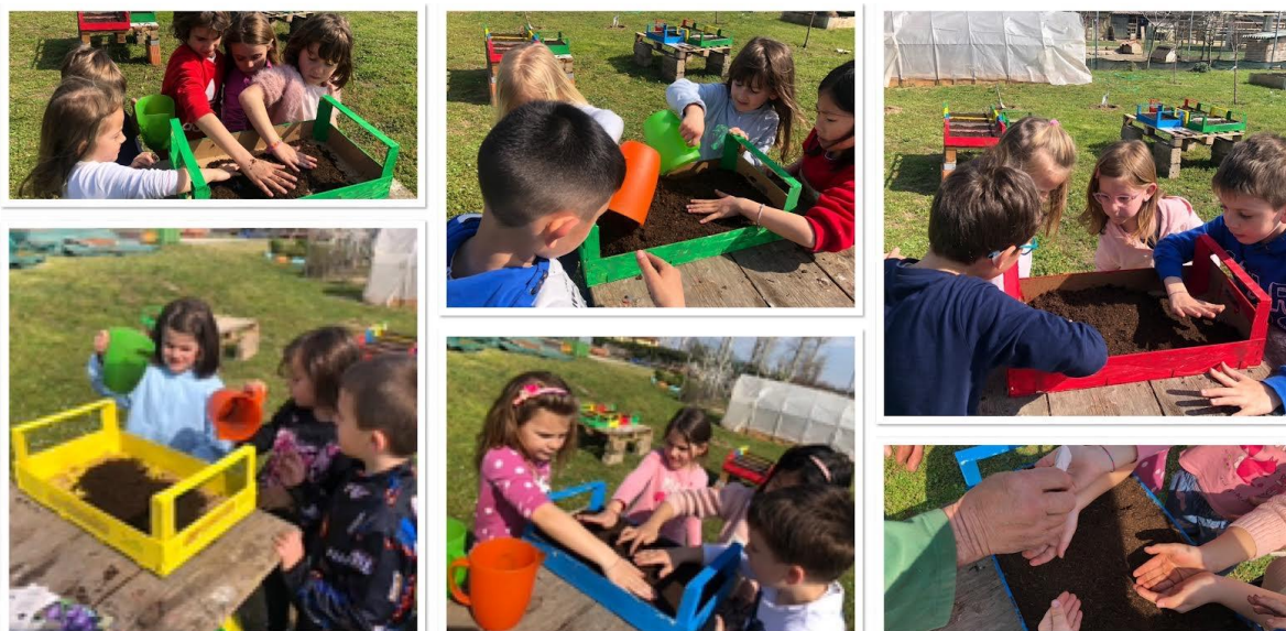
Seminiamo fiori in cassetta per colorare la vita. (1^D)