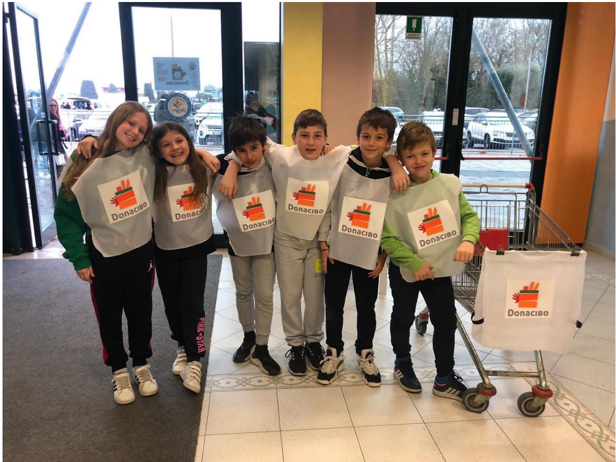
la felicità dell'essere solidali raccogliendo il CIBO per le persone meno fortunate (4^B)